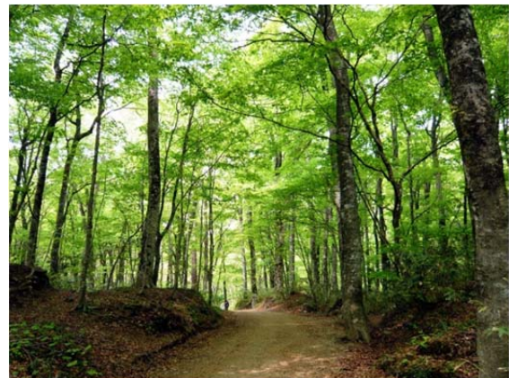
十二湖のブナ自然林