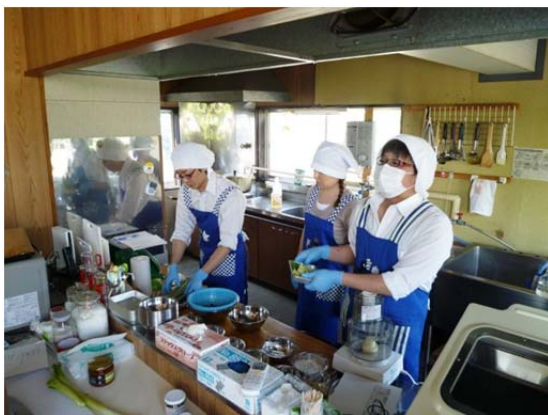
商品開発実習の様子