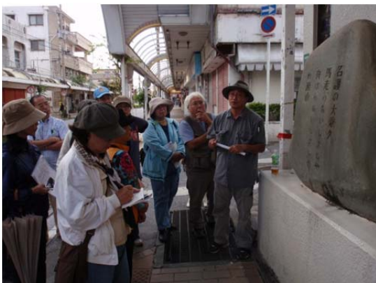
名護まちなかの名所巡り