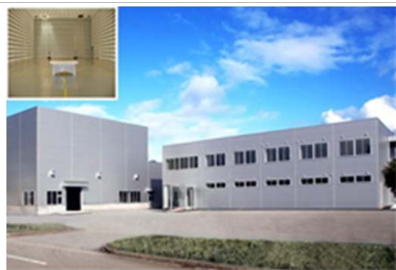
10m 法電波暗室も備えた富山県ものづくり 研究開発センター