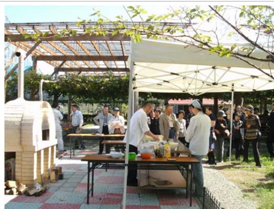
石窯を使ったピザ焼き講習会