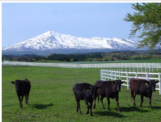
鳥海山の麓で育てられる秋田由利牛