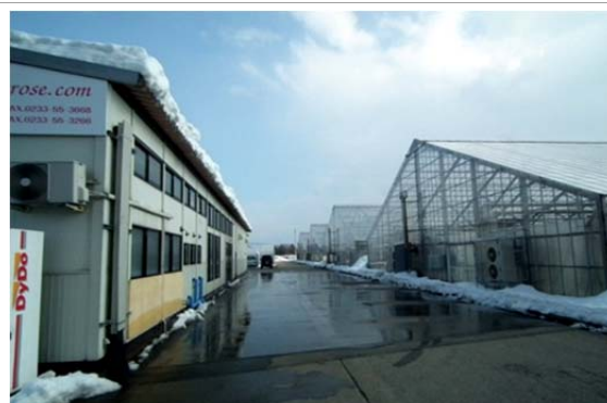
雪利用の冷房が期待される園芸ハウス