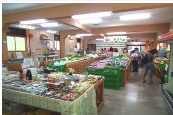
消費者と生産者を結ぶ産直施設