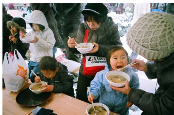
冬の味覚の風物詩 寒鱈まつり