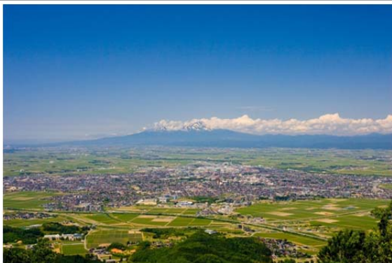
山里海に囲まれた豊穡の地