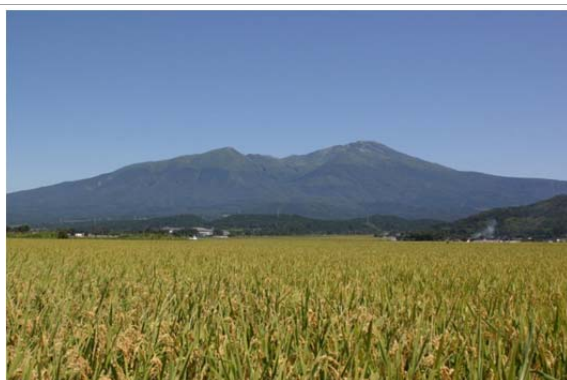
町のシンボル鳥海山と庄内平野の稲穂