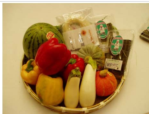
特産のパプリカなどの豊富な食材