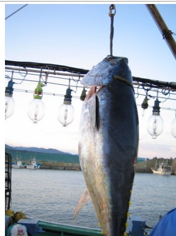
クロマグロの水揚げ状況（奥戸漁港）