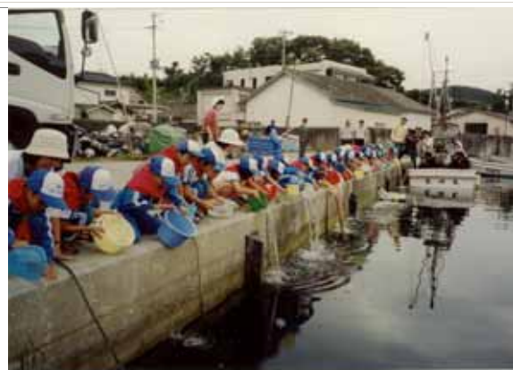
小学生による黒鯛の稚魚の放流