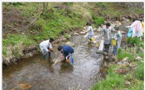
(写真) 町内小学校による川の水質調査