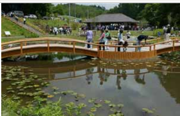
(写真) いわてまち川の駅