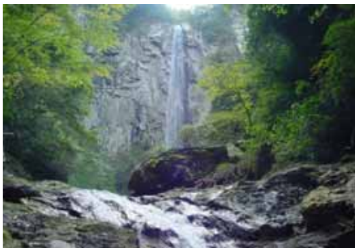
駅館川（東椎屋の滝）