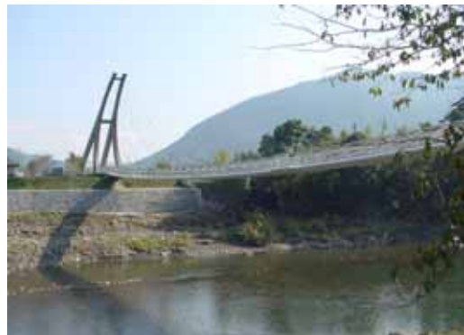
駅館川（つり橋公園）