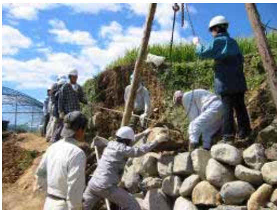
都市住民による棚田の石垣修復