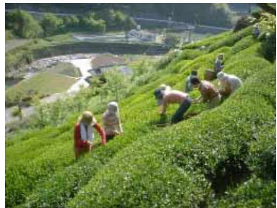
都市住民による農業体験（お茶つみ）