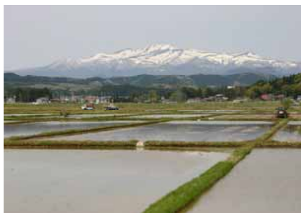
金成耕土から望む栗駒山