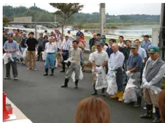
地域住民による 伊豆沼・内沼クリーンキャンペーン