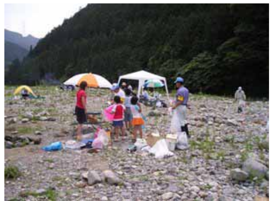
河川パトロールの様子