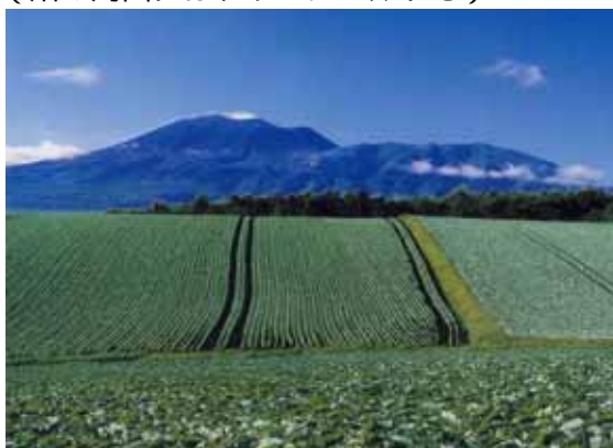
キャベツ畑より浅間山を望む (畑の周囲にはグリーンベルトも)