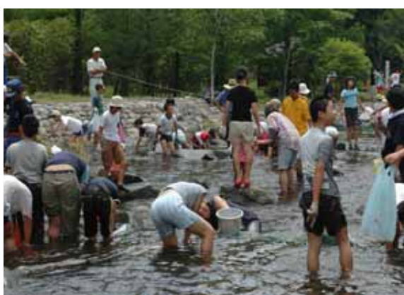
川で遊ぶ(マスつかみ)