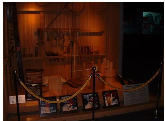
伝統工芸品の展示風景