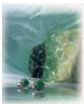
ヒスイの原石と加工品