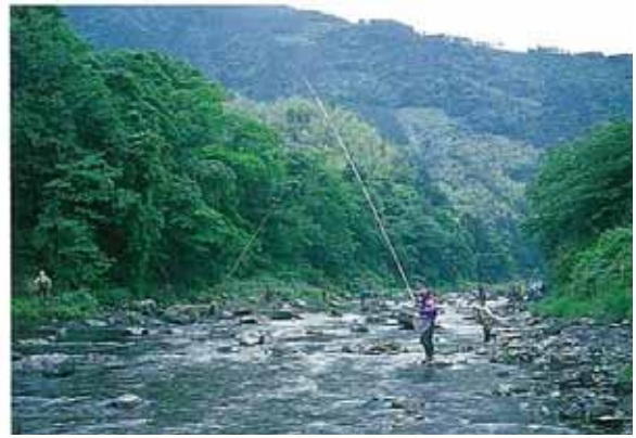
魅力ある豊かな自然環境でのアユ釣り