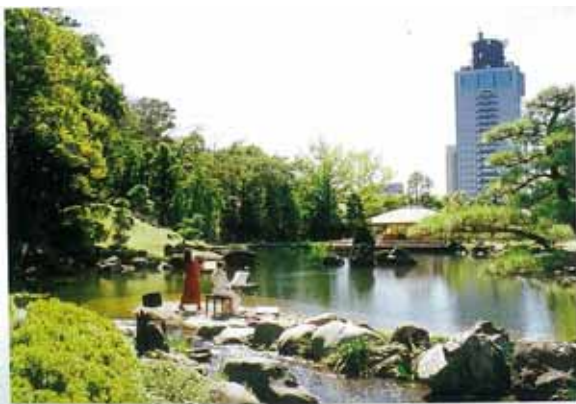
うるおいあふれる水とみどりの生活環境