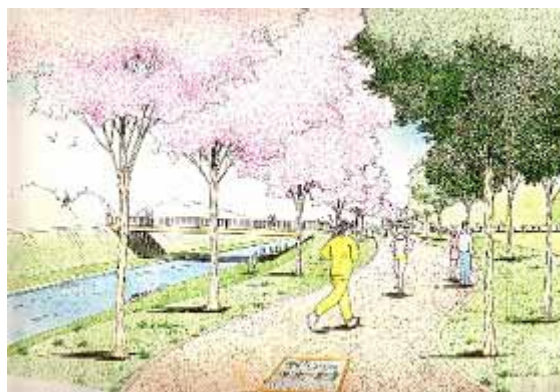
河川堤防を活用した緑道