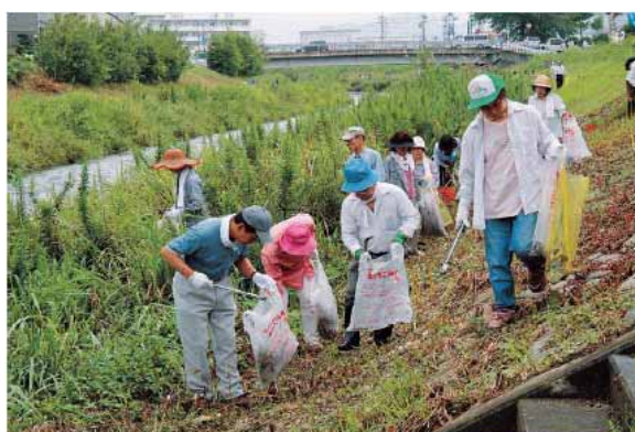
市民団体による環境美化活動