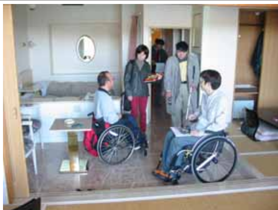
旅館でのバリアフリー調査