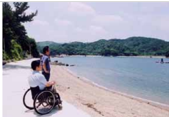
伊勢志摩の美しい自然を楽しむ