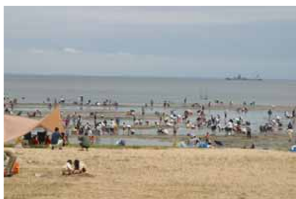
「御殿場海岸」潮干狩り