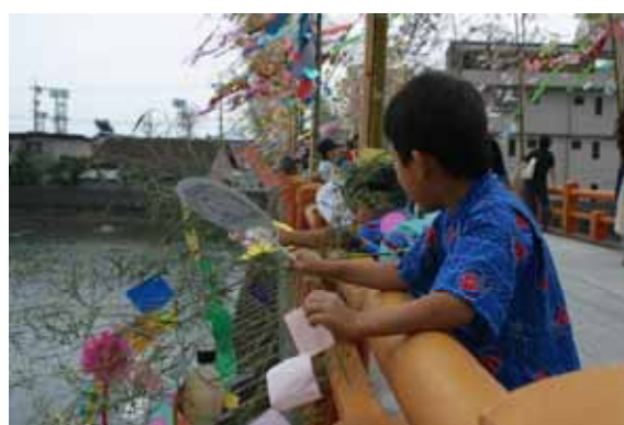
市民から親しまれている岩田川での笹流し