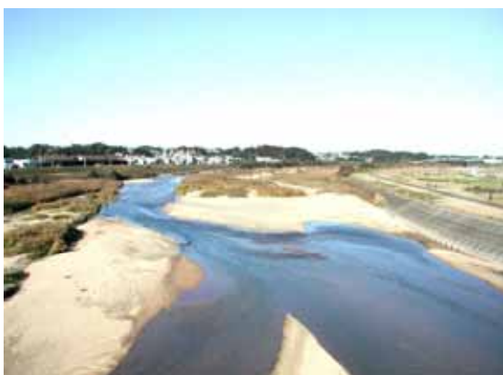
市の中央部を流れる鈴鹿川