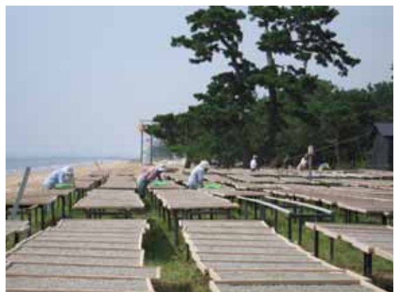
白砂青松の鼓ヶ浦海岸と名産小女子の天日干し