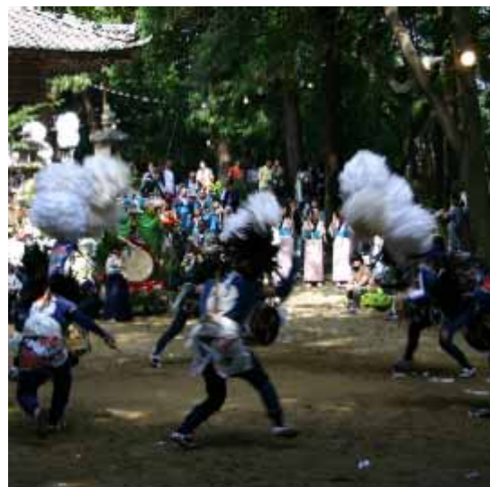
久居市の伝統芸能「かんこ踊り」