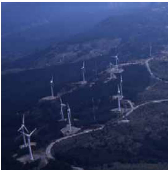
青山高原の風力発電施設