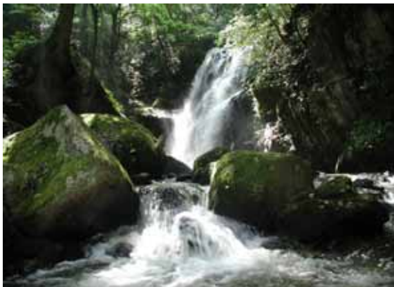
神宿る 大戸川の源流「 けいめい 鶏鳴の滝」