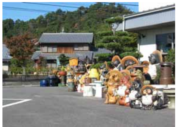
焼物と共に「住んでいて良かった」まち