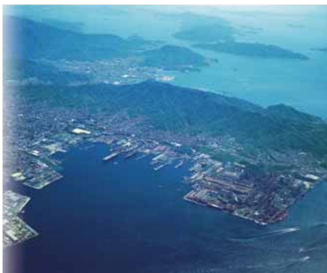
瀬戸内海に臨む市街地