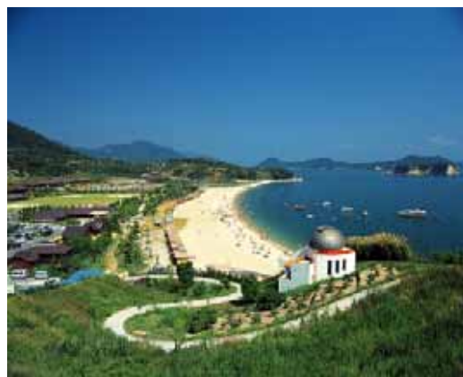
観光・レクリエーション施設