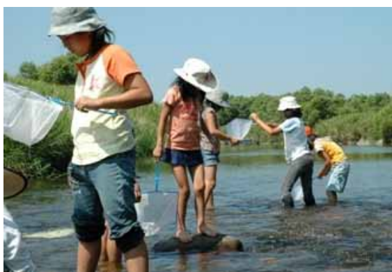
佐波川「水生生物観察会」