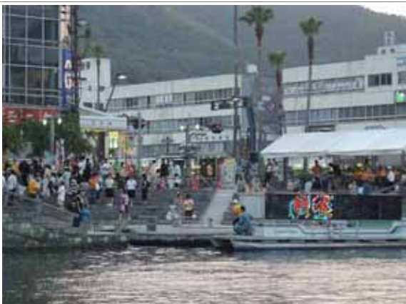
新町川水際公園での水辺を利用したイベント