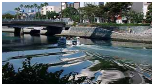
ひょうたん島クルージング遊覧船