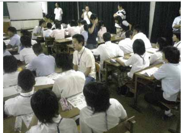
大学生と高校生の連携授業風景