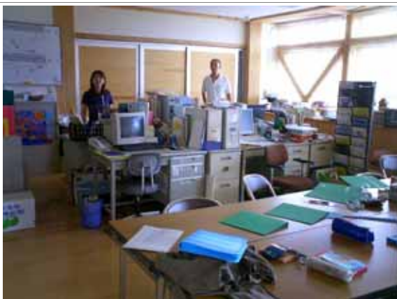
NPO砂浜美術館スタッフ