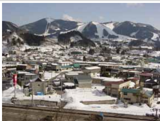
大鰐温泉スキー場の全景