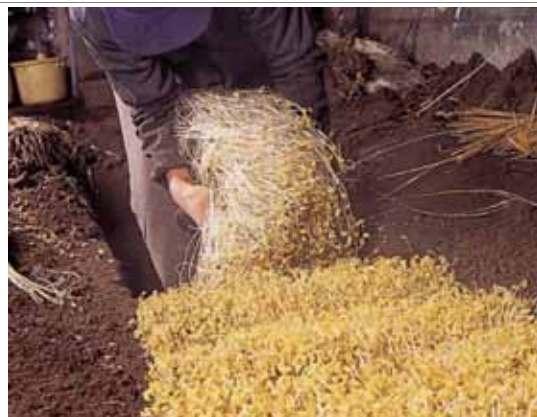
大鰐温泉もやしの収穫