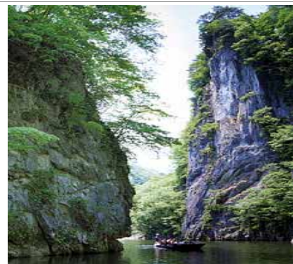
砂鉄川の清流化が進む日本百景「狢鼻溪」、 澄みきった渓谷と船下り