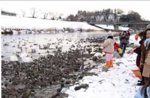
水質浄化により渡り鳥とふれあいの場が生まれた 磐井川