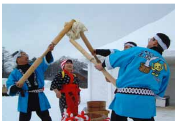
もちもち王国紫波ひめ隊