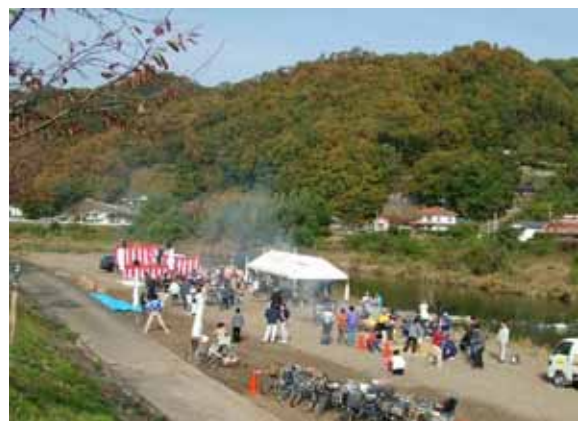
整備された小田川河川敷でのイベント