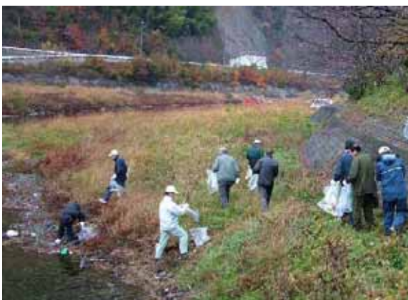
小田川のクリーン大作戦