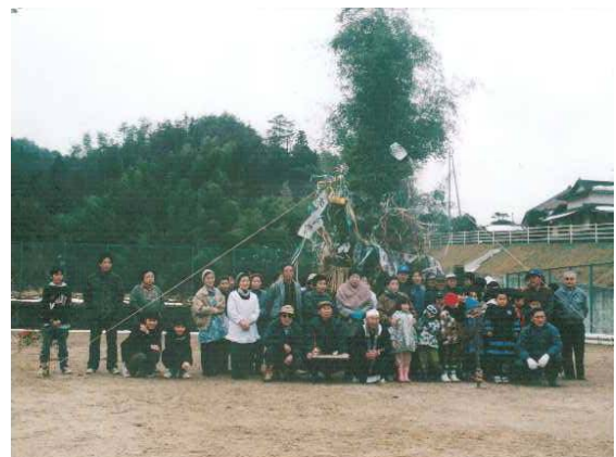
旧安田小学校での地域住民による伝統文化の継承風景