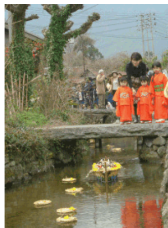
水辺・ふれあい・歴史