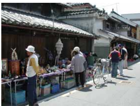
二層うだつの町並み