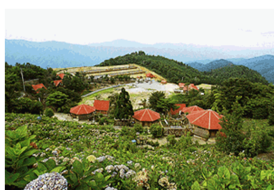
塩塚高原キャンプ場