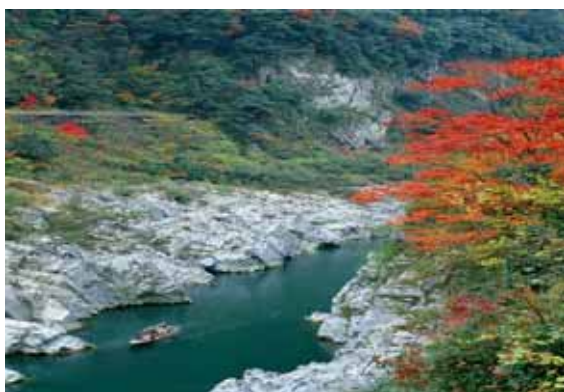
大歩危・小歩危溪谷