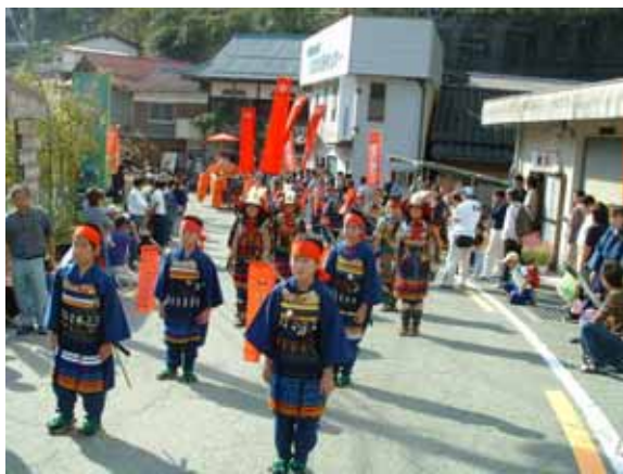
祖谷平家祭り（武者行列）