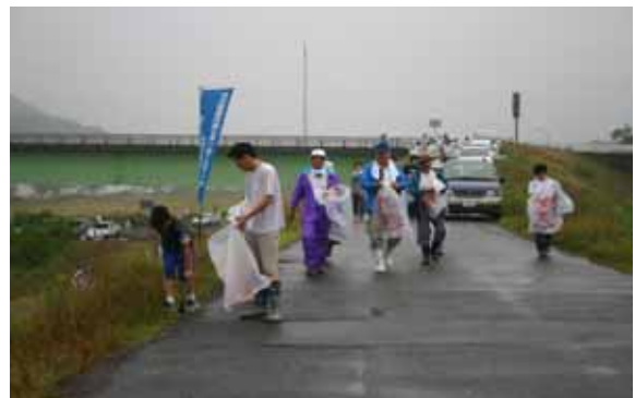
美馬市河川美化活動