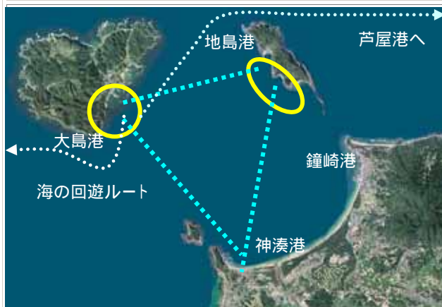
図 大島、地島、芦屋の各地域を結ぶネットワーク