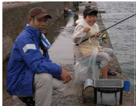
写真 大島親子釣大会(平成17年8月実施)