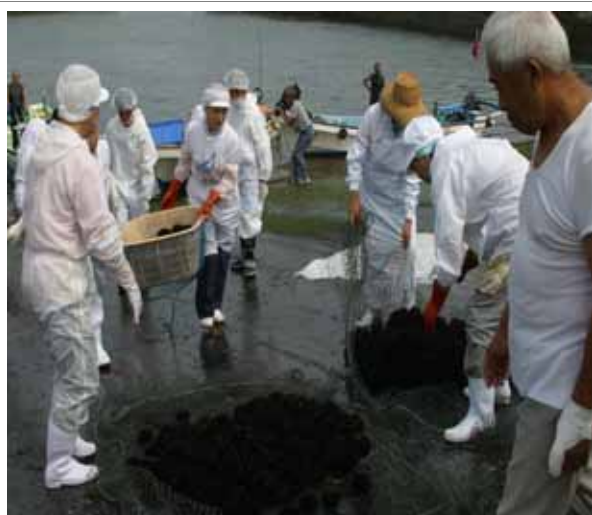
ウニ漁（ハサップ対策）