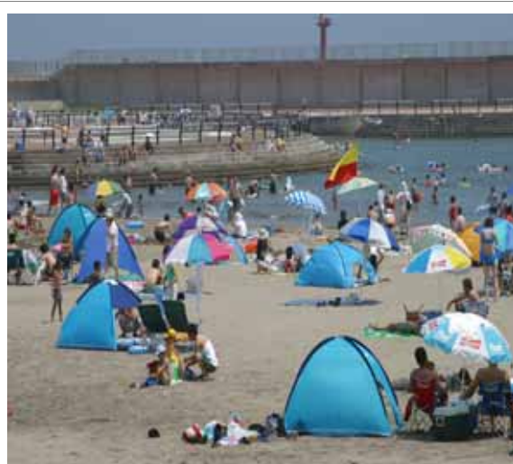
たねいち海浜公園