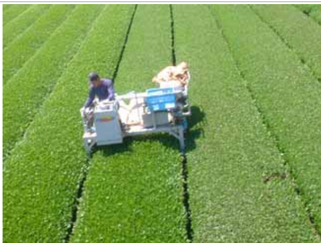
【乗用機械での茶摘み状況】