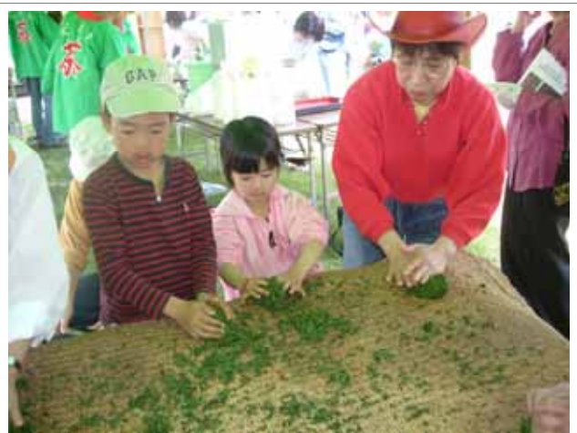
【都市住民によるお茶の手揉み体験】