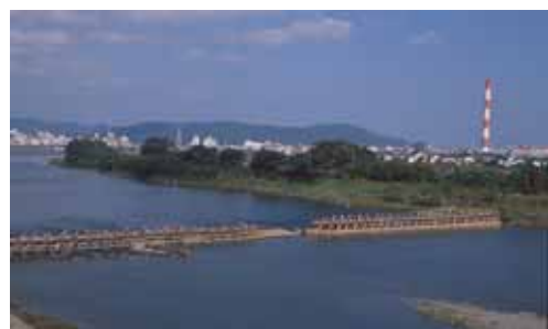
五ヶ瀬川に架かる鮎やな