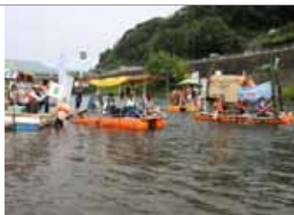
五ヶ瀬川イカダ下り