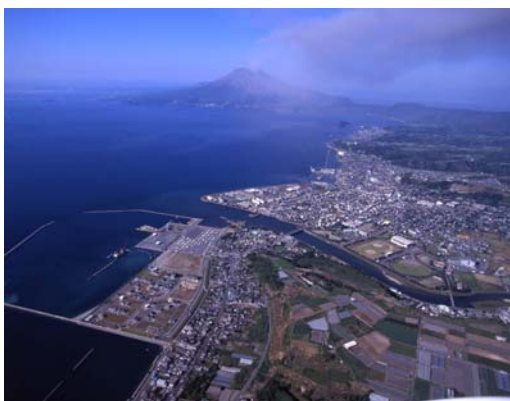
垂水市街地と桜島