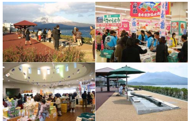
海の桜勘(おうかん)販売 道の駅の足湯・特産物直販