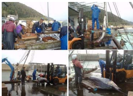
波見港 水揚げ状況