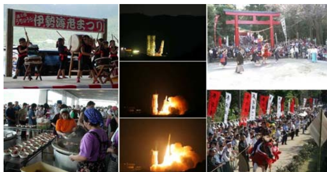
肝付町の観光 (伊勢海老祭り・内之浦ロケット・流鏝馬)