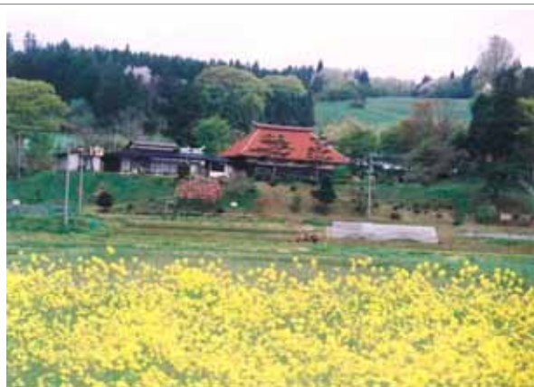
写真の「菜の花」の一部はバイオディーゼル燃料として活用