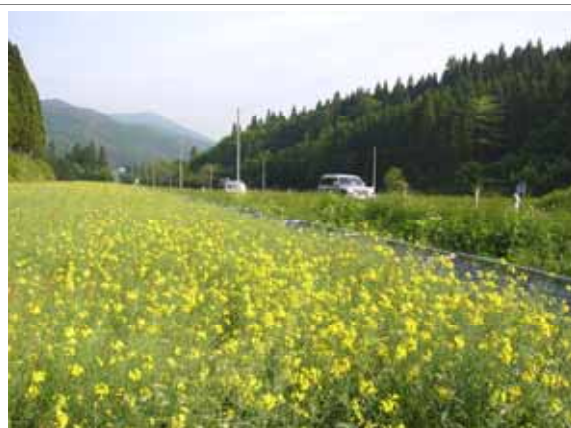
道路側の遊休農地を利用した「菜の花」栽培