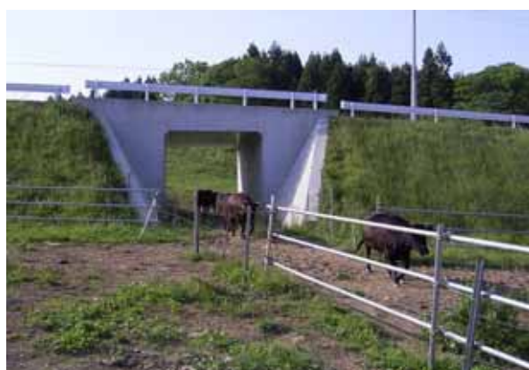
広域農道の横断函渠をくぐり抜ける放牧牛達