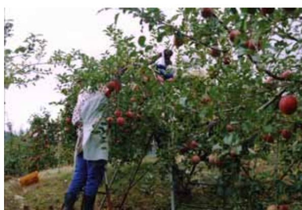
果樹園でのリンゴの収穫状況