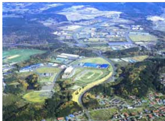
企業誘致が進む工業団地