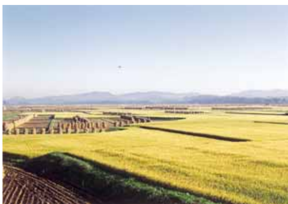
北上山地につながる田園地帯