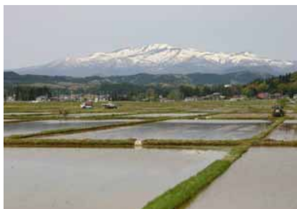
金成耕土から望む栗駒山