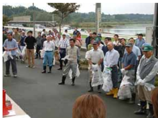
地域住民による 伊豆沼・内沼クリーンキャンペーン