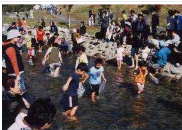
子供が安心して遊べる水環境を目指して