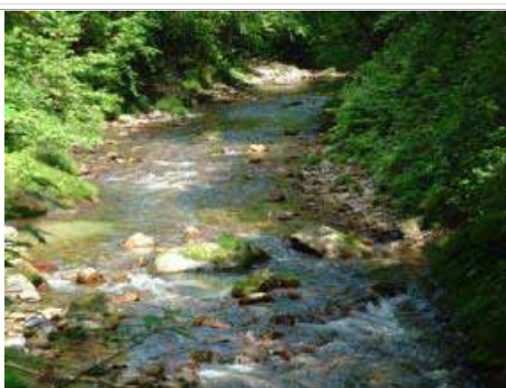
メダカの泳ぐ美しい清流の再生