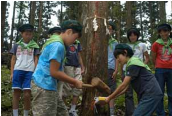
地域の子供たちにしっかりと「緑」を伝え