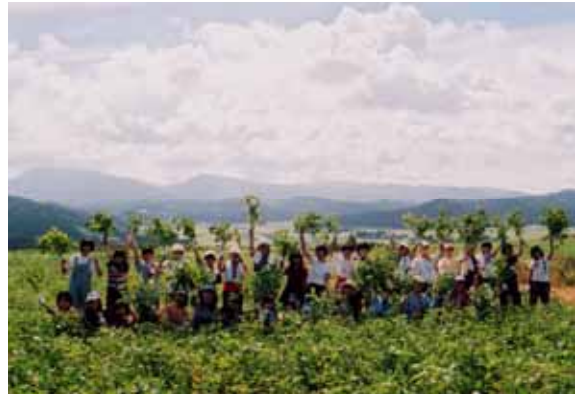
都会から修学旅行を受入れ（ファームステイ）